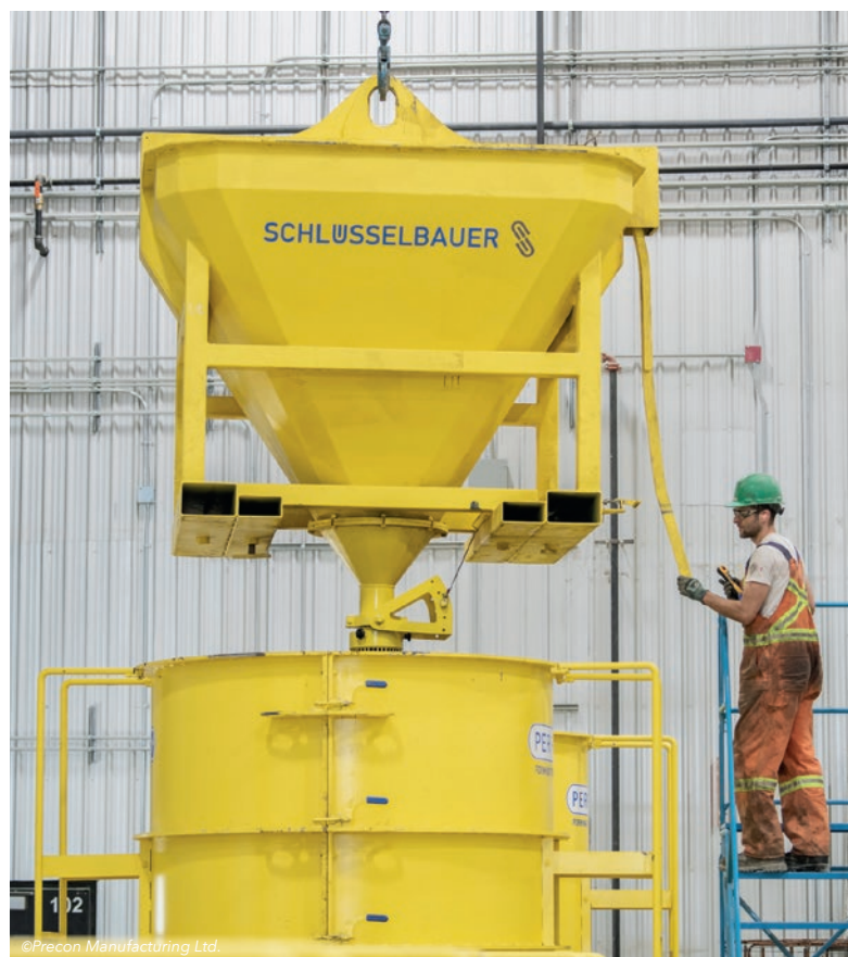
Mobilny silos do betonu może być obsługiwany za pomocą suwnicy lub wózka widłowego.

Przeglądając się historii rozwoju produkcji podstaw studni, zastosowanie lekkich prefabrykowanych kształtek z EPS do wykonania negatywu kinety stanowi zdecydowanie jeden z kamieni milowych. Do tej pory stosowanie różnych metod formowania kinety i spocznika prowadziło do dużego zróżnicowania jakości komponentów, dotyczy to m.in. ręcznego betonowania kanałów, nawet jeżeli praca wykonana została przez doświadczonego murarza. Zastosowanie prefabrykowanych kształtek ma wiele zalet w zakresie jakości przyłączy rurowych w ścianie studni. Przyłącze rurowe można precyzyjnie dopasować do położenia i nachylenia rury wejściowej, poprawiając w ten sposób hydraulikę w całym systemie kanalizacyjnym. Ponadto zastosowanie kształtek przyłączeniowych w technologii Perfect eliminuje żmudny proces montażu i demontażu często stosowanych w przeszłości metalowych odcisków (tzw. potocznie „garnków”), co stanowi prawdziwy postęp w produkcji studni, zarówno pod względem jakości, jak i ergonomii. Dotyczy to w równym stopniu instalacji w Precon Manufacturing Ltd., którą tu opisujemy, jak i całej branży.