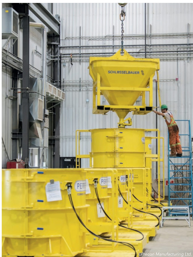
Formy o różnej wysokości konstrukcyjnej są napełniane betonem samozagęszczalnym.

kinety i przyłączy rurowych. Ta charakterystyka, która wykorzystana została w procesie rozwoju nowych technologii w firmie Schlüsselbauer, okazała się także idealną odpowiedzią na potrzeby Precon Manufacturing Ltd. Wdrożenie produkcji z betonu zagęszczanego (SCC) nie tylko umożliwiło wykorzystanie systemu produkcyjnego Perfect, ale także przyczyniło się do spełnienia wysokich wymagań w zakresie szczelności elementów.