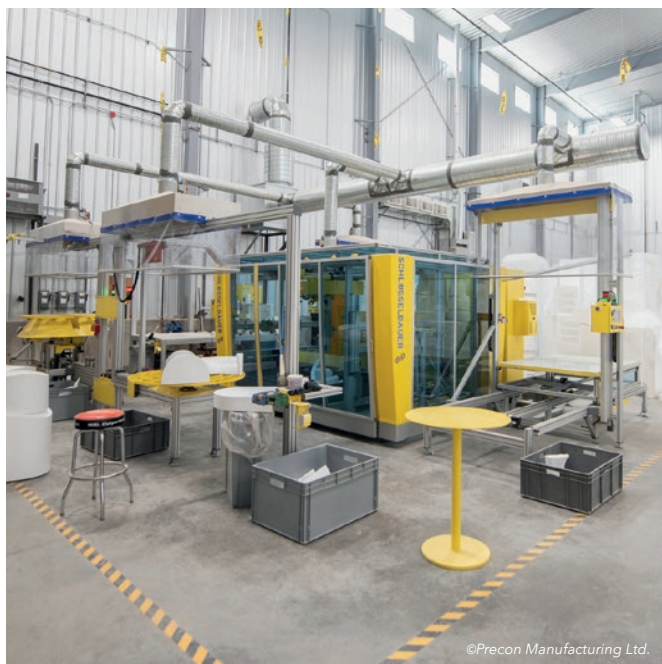
Montowanie negatywu kinety z prefabrykowanych kształtek EPS – centrum system produkcji Perfect w Precon Manufacturing Ltd.

Inżynieria materiałowa jest jednym z dwóch kluczy do sukcesu. Firma Schlüsselbauer Technology dostrzegła, że postęp w technologii betonu w ciągu ostatnich kilku dekad był okazją do wdrożenia nowych procesów produkcyjnych. W przeciwieństwie do suchego betonu wibrowanego, beton samozagęszczalny może zostać użyty do formowania bardziej wymagających kształtów – tak jak w przypadku formowania