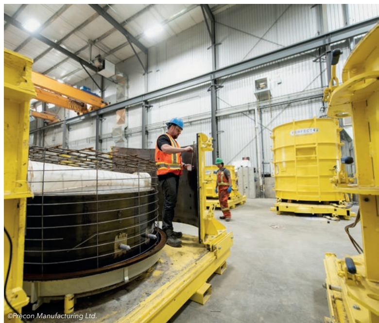
Przygotowanie formy: negatyw kinety, zbrojenie, dyble do późniejszego montażu szczebli żłazowych.