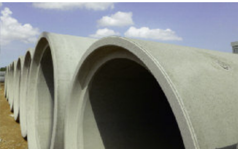
Widoczna gołym okiem jakość produktów uzyskana jest dzięki stalowym pierścieniom górnym, nawet w przypadku rur o średnicy DN1800.

2500x2500 mm). Technologia produkcji Exact XL dostarczona przez firmę Schlüsselbauer jest wyposażona w dwie osobne stacje produkcyjne, które dzięki hydraulicznym mocowaniom rdzenia można bardzo szybko przebroić i przygotować do produkcji