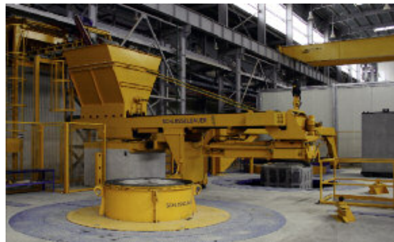
Uniwersalny system Exact XL jest gotowy do produkcji następnej rury.