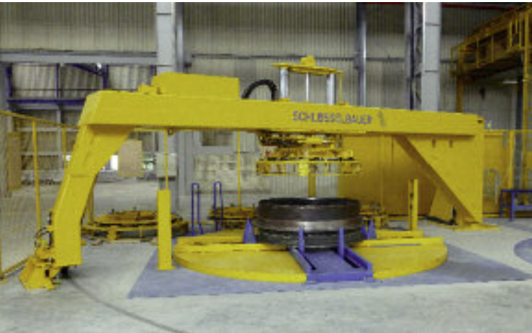
Stalowe pierścienie górne umieszczane są w maszynie automatycznie przed rozpoczęciem produkcji i pozostają na wyrobie przez cały czas dojrzewania.

pożądanego wyrobu. W ciągu pierwszych tygodni od uruchomienia maszyny, jednej stacji używano do produkcji wyrobów o przekroju okrągłym, drugiej do wyrobów o przekroju prostokątnym. Praca podajnika betonu jest zsynchronizowana – napelnia jedną stację, w czasie gdy na drugiej następuje rozformowanie produktu oraz przygotowanie do kolejnego cyklu. Dzięki wibracjom o wysokiej częstotliwości, wilgotny beton zagęszcza się równomiernie na całej wysokości elementu betonowego. Solidna prasa o bardzo dużym nacisku pozwala na produkcję elementów prostokątnych w tej samej technologii co rury i kręgi bez strat jakościowych.