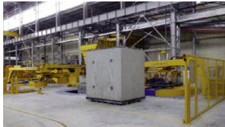
Użycie stalowych pierścieni górnych w technologii produkcji Exact XL pozwala na produkcję dokładnych wyrobów – rur oraz elementów ramowych.

Oferta firmy Amiantit Oman Concrete Products LLC zawiera szeroki zakres produktów – od elementów studni (średnice DN1200, DN1500 oraz DN1800) poprzez rury (średnice od DN700 do DN1800) do prostokątnych profili (wymiarów od 2000x1500 do