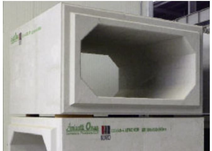
Zapotrzebowanie na element ramowy w konstrukcji infrastruktury jest duże, szczególnie w budownictwie drogowym. Pozwalają na szybkie odprowadzanie wody podczas intensywnych opadów i zapobiegają podtopieniom.

Warto w tym miejscu podkreślić, że poza tą ogromną różnorodnością typów produktów końcowych, nie można pominąć także szerokiego zakresu średnic i wysokości, w których mogą one być wytwarzane. Zakład wyposażony został w cztery formy dla różnych geometrii elementów prostokątnych, technologię formowania dla pięciu różnych średnic rur, formy dla pokryw studni w 3 różnych średnicach oraz formy na potrzeby produkcji kręgów także w 3 średnicach, umożliwiające produkcję w 10 wariantach wysokości, w każdym przypadku od 300 do 1500 mm. Maksymalna dopusz-