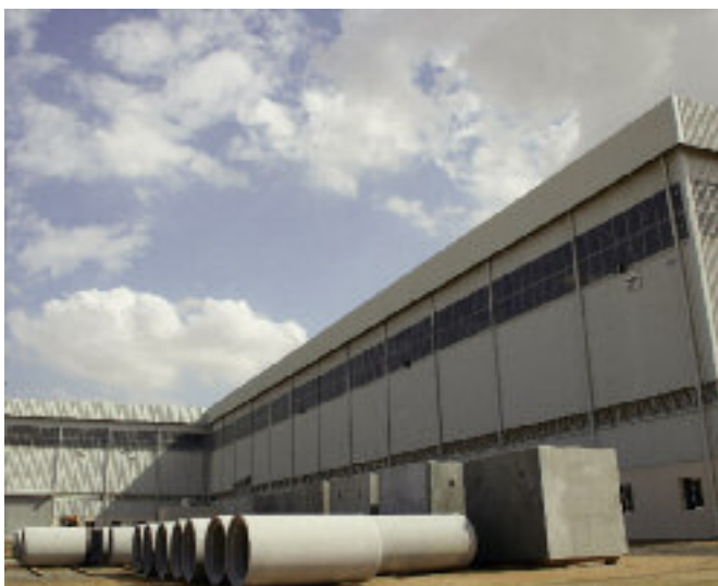
Amiantit Oman, firma wyspecjalizowana w branży budownictwa, została założona w 1974r. i zatrudnia aktualnie ponad 900 osób, z czego około 80 z nich w swojej spółce Amiantit Oman Concrete Products LLC.

Technologia produkcji Exact XL umożliwia produkcję rur z oraz bez wykładziny wewnętrznej przy minimalnych pracach przebrojenowych. Co więcej, zastosowanie stalowych pierścieni górnych gwarantuje bardzo wysoką dokładność wymiarową bosego końca wszystkich wyrobów, a co za tym idzie, precyzyjne i szczelne połączenia. Dokładność wymiarowa jest kluczowym czynnikiem decydującym o jakości zarówno rur, jak i elementów studni. Podczas produkcji w technologii Exact XL szczeble włączowe zostają zamontowane bezpośrednio w wyrobie, ewentualnie możliwe jest pozostawienie odpowiednich wgłębień na wewnętrznej ścianie produktu, które umożliwią ich późniejszy montaż. Maksymalna całkowita długość wyrobu w technologii Exact XL wynosi 3600 mm, maksymalna średnica wyrobu wynosi także 3600 mm. Do obsługi dwóch stacji