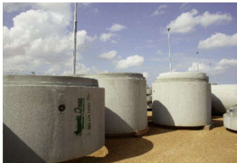
Kręgi betonowe o dużych średnicach produkowane są także w systemie Exact XL.