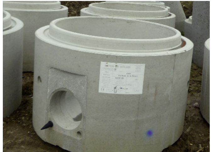
Także połączenie rury z podstawą studni może zostać wykonane z użyciem konektora oraz bolców przejmujących obciążenia ścinające.