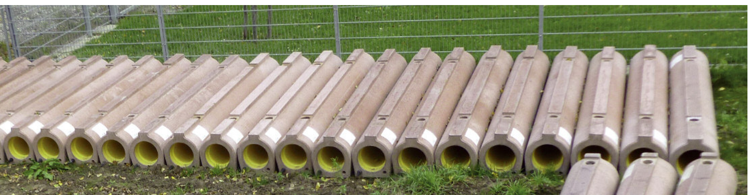
Typowy magazyn rur Perfect Pipe DN250 na budowie (Endingen, Kaiserstuhl).

Wytrzymałe rury betonowe lub żelbetowe z założenia są cięższe w przeliczeniu na metr bieżący w porównaniu do alternatywnych materiałów, szczególnie w przypadku rur ze stopką (Perfect Pipe często produkowane są w tym wariantcie). Bezpieczeństwo w czasie produkcji, transportu oraz prac montażowych staje się bardzo istotnym aspektem. Dlatego w przypadku technologii Perfect Pipe prawie wszystkie etapy wykonawcze są zautomatyzowane, pracownicy