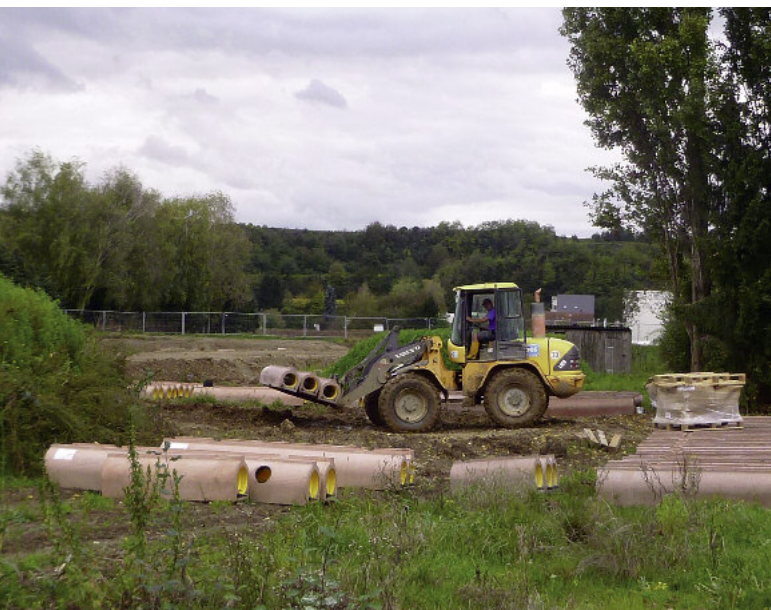
Mimo wagi rury transport rur na budowie jest bardzo prosty.

odpowiedzialni są za kontrolę i lekkie prace manualne. Przykładem takich prac może być przenoszenie wykładzin PE-HD (Inliner) czy umieszczenie kotw transportowych w formie. Po dojrzeniu betonu kotwy te są bardzo mocno osadzone w betonie i umożliwiają pewną obsługę transportową – bezpieczne rozładowanie na placu budowy oraz dobrą kontrolę podczas umieszczania rury w wykopie. Geometria rury ze stopką ułatwia także transport i magazynowanie – rury można bezpiecznie sztaplować. Bezpieczeństwo pozostaje priorytetem także podczas samego montażu. Dlatego opracowano specjalne urządzenie do naprowadzania rury, które umożliwia idealne ustawienie w stosunku do przyłącza (konektora), zarazem chroniąc ręce pracowników. Producenci rur proponują zintegrowane rozwiązania, które zwiększają bezpieczeństwo wszystkich pracowników na każdym etapie produkcji i montażu, co jest wyjątkowo doceniane przez inwestorów i wykonawców.