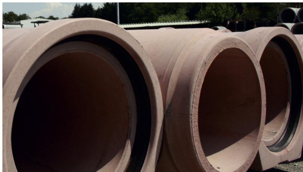
Rury betonowe mogą być wytwarzane do średnicy DN1200 w różnych geometriach.