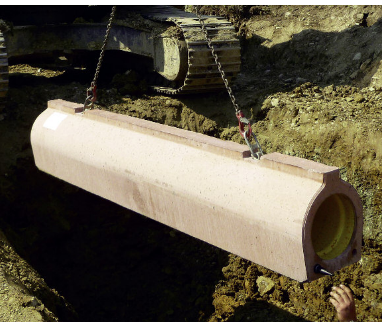
Opuszczenie rury do wykopu za pomocą mocno osadzonych kotw transportowych.