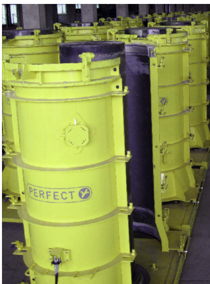
Wyposażenie do seryjnej produkcji dojrzewających w formach rur.

Schlüsselbauer Technology GmbH & Co KG Hörbach 4 4673 Gaspoltshofen, Austria T +43 7735 71440 · F +43 7735 714456 sbm@sbm.at, www.sbm.at · www.perfectsystem.eu