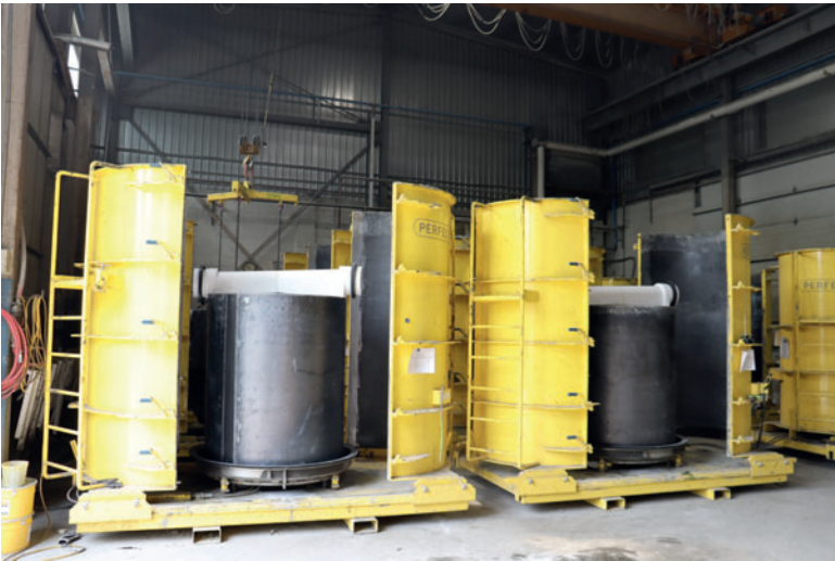
Формы имеют двухкомпонентную оболочку и могут симметрично раздвигаться