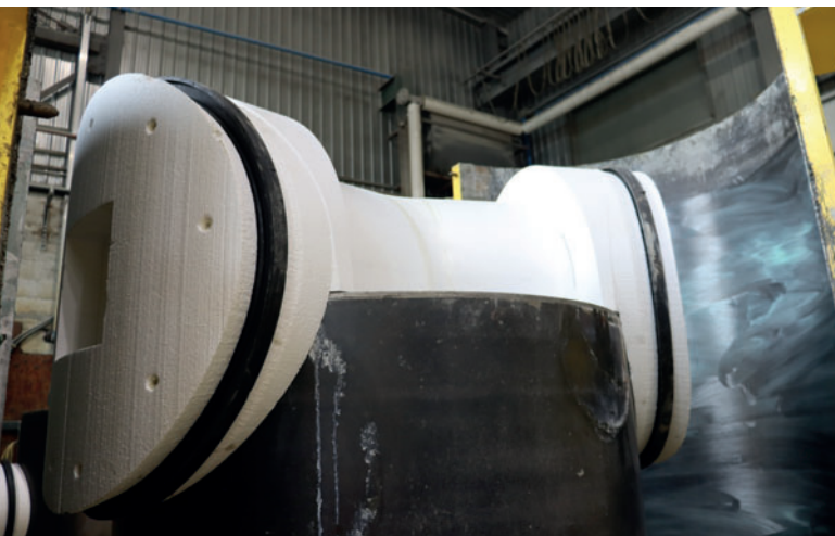
Готовый негатив вкладыша крепится с помощью магнитов