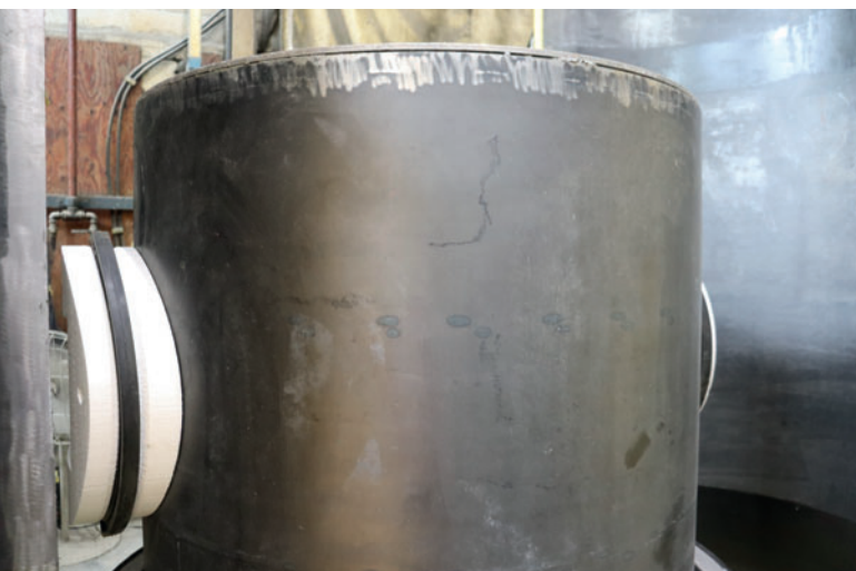
Негативы вкладышей для соединительных муфт с интегрированным уплотнением могут устанавливаться непосредственно на стальной сердечник формы

и поднимают элемент из стальной формы. Процесс поворота происходит во время транспортировки к месту складирования. Элемент колодца снабжен наклейкой со всеми соответствующими данными и параметрами и идентификационным номером, нанесенным с помощью аэрозольной краски. Таким образом, изготовленный на заказ монолитный элемент всегда можно точно проследить вплоть до монтажа.