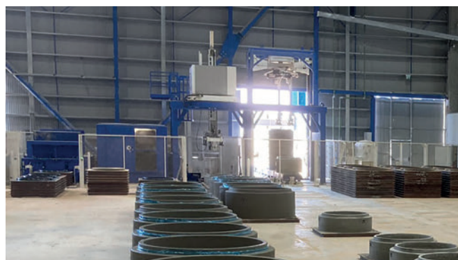
La paletización de los productos, la limpieza y el engrasado del encofrado anular también se realizan de forma totalmente automática además de la propia fabricación.

Schlüsselbauer Technology GmbH & Co. KG Hörbach 4, 4673 Gaspoltshofen, Austria T +43 7735 71440 sbm@sbm.at , www.sbm.at