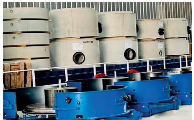
Con la pinza giratoria hidráulica, las bases para pozos Perfect se desencofran de los moldes y se colocan en la posición de montaje.

sión, las piezas de molde para dar forma a las conexiones de tubos necesarias con o sin juntas se fijan en la estructura del pozo. El canal negativo producido de este modo con apenas unos pasos se introduce en un molde que, a continuación, se fija con imanes a los moldes exteriores. Un agente separador aplicado con una esponja es igual de válido para todos los moldes y materiales (juntas, canales EPS, molde de acero) y contribuye además con la calidad de superficie en el componente para pozos fabricado.