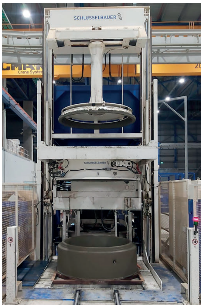
La instalación Magic para la fabricación en masa de anillos de pozo de diámetros nominales de 800, 1000, 1250 y 1500 mm.

productos se realiza de forma totalmente automática, hasta que están en el exterior de la nave, en la cinta de descarga, listos para transportarlos a la zona de almacenamiento. En relación con la capacidad de producción y la calidad de los componentes, Sela dispone de esta nueva técnica de producción en una de las fábricas de pozos más modernas de la región del Mediterráneo. Se ha dado así un paso signifi-