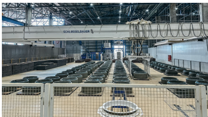
La zona de endurecimiento para los anillos de pozo estándar con la grúa automática Transexact.

productos se realiza de forma totalmente automática, hasta que están en el exterior de la nave, en la cinta de descarga, listos para transportarlos a la zona de almacenamiento. En relación con la capacidad de producción y la calidad de los componentes, Sela dispone de esta nueva técnica de producción en una de las fábricas de pozos más modernas de la región del Mediterráneo. Se ha dado así un paso signifi-