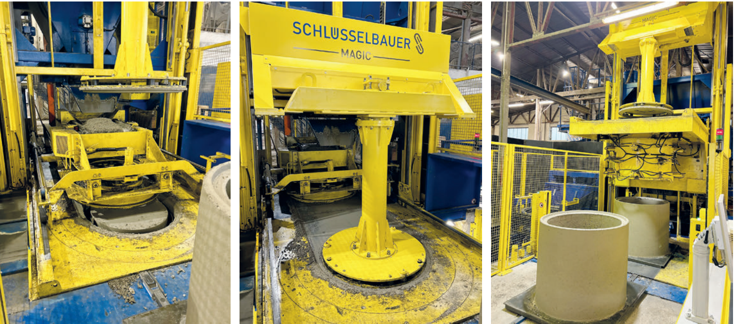
Fabricación de un anillo para pozos con la Magic 1501

con alturas de hasta 1500 mm, así como de distintos elementos de construcción en grandes cantidades. La máquina permite la producción individual o múltiple de hasta seis piezas prefabricadas y está diseñada para unas dimensiones de producto máximas con diámetros exteriores de hasta 1800 mm en caso de producción individual. En Kühne, se fabrican anillos y conos para pozos con la Magic 1501.