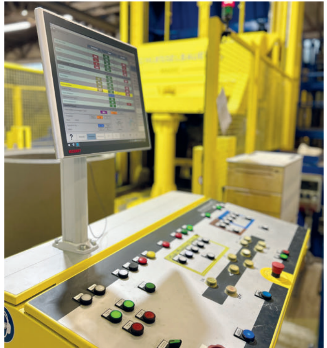
Cómodo control en el panel de mando

Kühne se decidió por una Magic 1501 como máquina independiente. No habría sido posible implementar fácilmente el otro concepto con el espacio disponible, que era limitado. Las naves de producción están completamente llenas y no se puede aumentar la superficie de producción en la ubicación actual. La Magic 1501 es una instalación de producción de componentes para pozos, como anillos y conos excéntricos