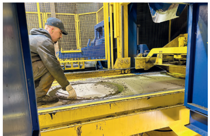
Colocación del anillo de refuerzo durante la producción del anillo para pozos