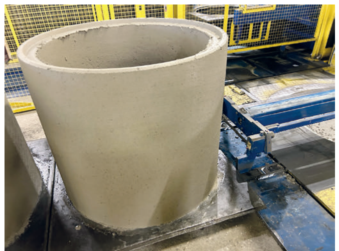
El nuevo producto se empuja dentro del encofrado inferior hacia fuera de la máquina

En Kühne, la producción completa de piezas para pozos se realiza con tres empleados, aunque bastaría con dos con ese grado de automatización. Así, Kühne consigue unas condiciones de trabajo tranquilas y la producción puede continuar en el caso de que falte un empleado, ya que siempre hay varias personas con experiencia presentes en la instalación.