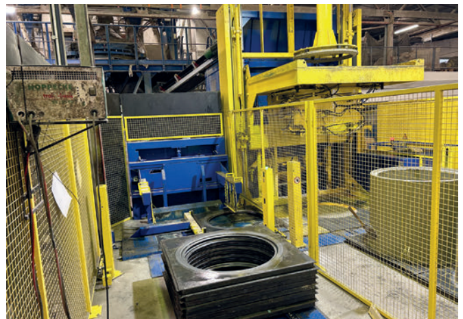
Colocación del anillo de refuerzo durante la producción del anillo para pozos