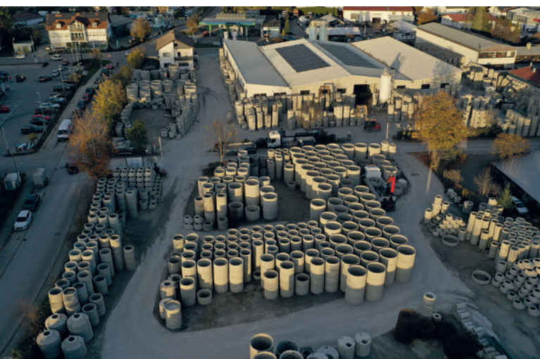
Las instalaciones de Betonwerk Kühne en Geretsried, cerca de Múnich