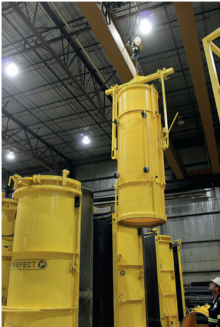
Después, una grúa transporta el liner preparado al molde (con manguitos) y lo coloca sobre el núcleo de molde reducible