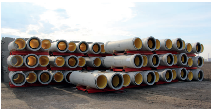
Perfect Pipe en el almacén exterior de Con Cast Pipe