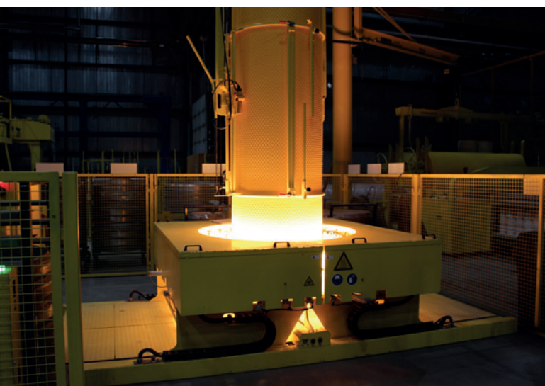
Conformación de manguitos en la estación de transformación

«El sector del hormigón ha cambiado tanto en la pasada década, sobre todo en lo relacionado con las aguas residuales, como no lo había hecho en conjunto durante los anteriores