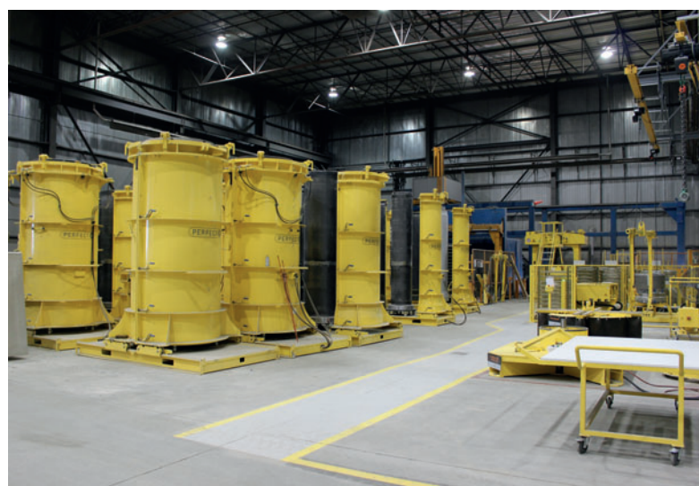
Estación de moldes de la fábrica Perfect Pipe de Con Cast Pipe

Posteriormente, se utiliza la grúa para depositar el liner en la estación de transformación. Aquí, un extremo del liner con forma de cilindro se somete a un proceso termoplástico que le otorga la forma del manguito posterior, con el liner montado sobre un manguito de acero. Durante el siguiente paso, el liner se gira y regresa a la estación de transformación. En ella se da forma al segundo extremo y se coloca el manguito de acero.