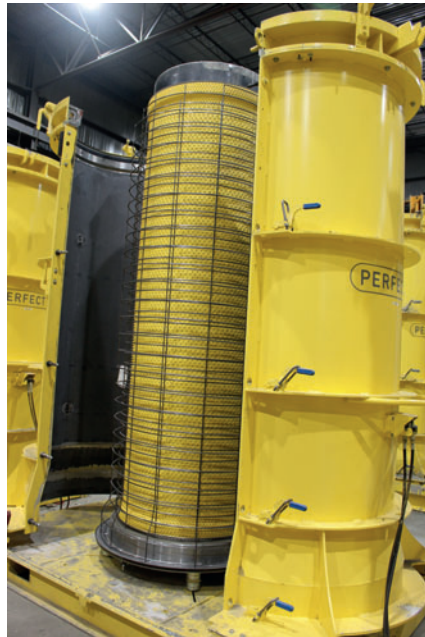
Totalmente preparado con liner y jaula de armadura