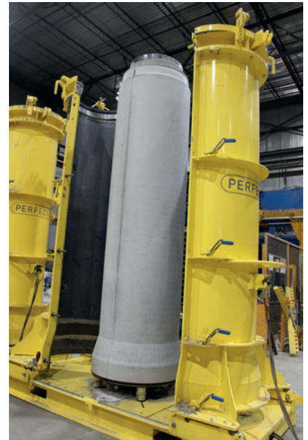
Tubo compuesto endurecido Perfect Pipe

50 años. En la actualidad, las nuevas técnicas de producción permiten alcanzar calidades y resistencias de las piezas de hormigón prefabricado tan elevadas que este ya no se encuentra en desventaja frente a otros materiales, sino que, además, en muchos casos es la primera opción», explica Brian R. Wood satisfecho con el desarrollo.