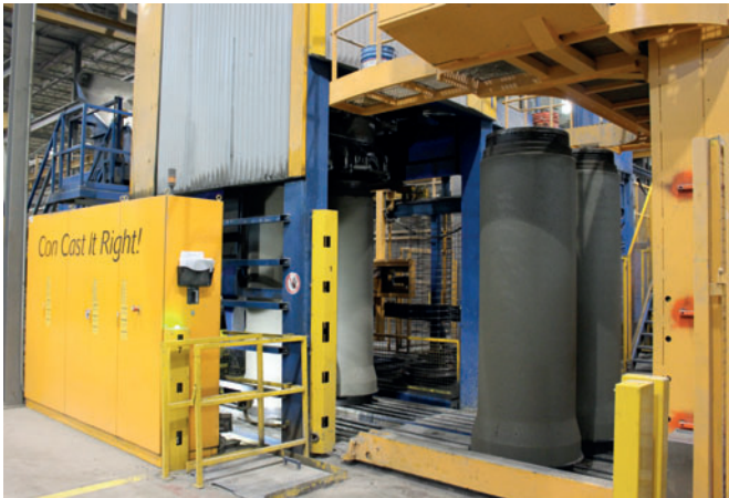
El Exact 2500 de Schlüsselbauer se utiliza desde 2002

Los tubos de hormigón fundido Perfect Pipe se pueden producir sin liner con el mismo proceso, lo que permite la producción en masa de tubos de hormigón fundido y encofrados. Según los requisitos del proyecto, los tubos se pueden producir con o sin junta integrada y, de forma opcional, de hormigón o de hormigón armado.