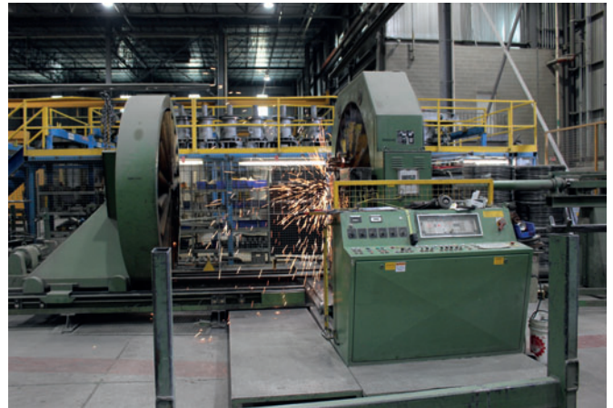
Uno de los dos sistemas de soldadura de jaulas MBK utilizados en Oakville

Según las indicaciones del fabricante, la resistencia a la extracción de las anclas es de más de 250 N cada una, y el liner en su totalidad puede resistir de forma fiable una presión permanente del agua subterránea de 1,5 bar. El liner tampoco se suelta del hormigón que lo rodea en caso de oscilaciones considerables de la temperatura.