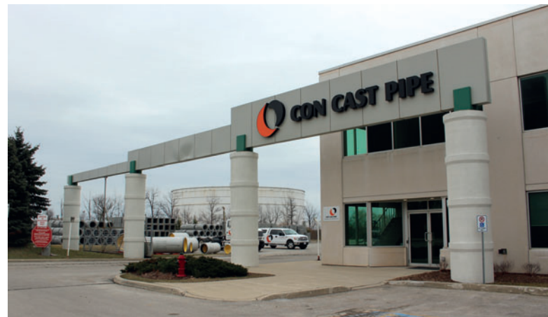
Con Cast Pipe en Oakville

La empresa Con Cast Pipe, fundada en 1989, produce en tres plantas ubicadas en Guelph, Oakville y St. Catharines, todas ellas en la provincia de Ontario. La exitosa trayectoria de la empresa comenzó en Guelph, donde se elaboraron las primeras piezas prefabricadas de hormigón. En 2002 se puso en marcha la planta de Oakville, lugar en el que se encuentra actualmente la nueva fábrica de Perfect Pipe.