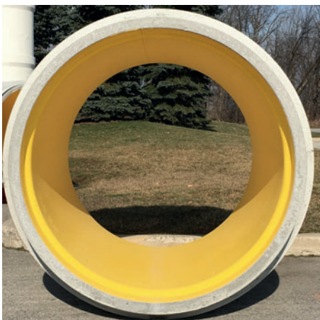
El liner se compone de polietileno (HDPE) de gran calidad, un material resistente a ataques químicos

Con Perfect Pipe, Schlüsselbauer Technology ha inaugurado una nueva era en la canalización de aguas residuales. Durante el proceso productivo se establece una unión duradera entre liners de plástico de gran calidad (polietileno) y tubos de hormigón muy resistentes, algo que permite satisfacer los requisitos básicos de los tubos para aguas residuales. Entre ellos se incluyen la resistencia frente a ataques químicos intensificados, una capacidad de carga estática elevada incluso con cargas de tráfico, la manipulación sencilla en la obra y la mayor seguridad durante la instalación y el uso.