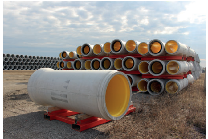
Con Cast Pipe ha producido bastidores especiales sobre los que colocar los tubos para el almacenamiento y el transporte posterior a la obra

totipos presentados en la bauma 2010 supusieron todo un avance: así, en ellos vieron una incorporación posterior óptima para su valiosa gama de pozos. La primera fábrica de Perfect Pipe se puso en marcha en 2012, en las instalaciones de Bernhard Müller GmbH en Achern, Alemania, y pronto recibió una visita de Con Cast Pipe. La dirección de la empresa pudo constatar in situ las posibles ventajas que planteaban los nuevos tubos de hormigón.