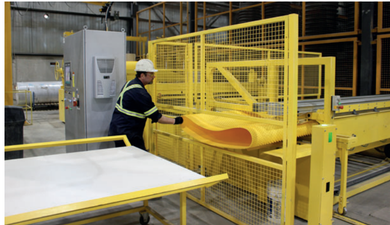
El liner ya soldado se expulsa de la máquina y es recogido por un empleado

Una grúa transporta después el liner preparado al molde, equipado con agentes separadores, y lo coloca sobre el núcleo de molde reducible. Después se inserta una jaula de armadura con separadores. Por último, se cierra el molde. En Con Cast Pipe el cemento se vierte manualmente utilizando un recipiente de hormigón.