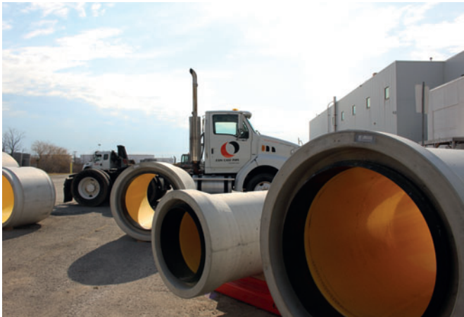
Estación de muestras con distintos tubos compuestos de plástico y hormigón Perfect Pipe