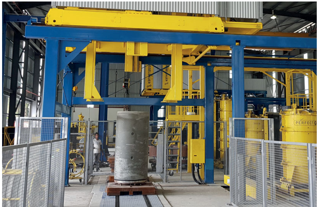
Tras el endurecimiento en el molde se desencofran los tubos de hincado.