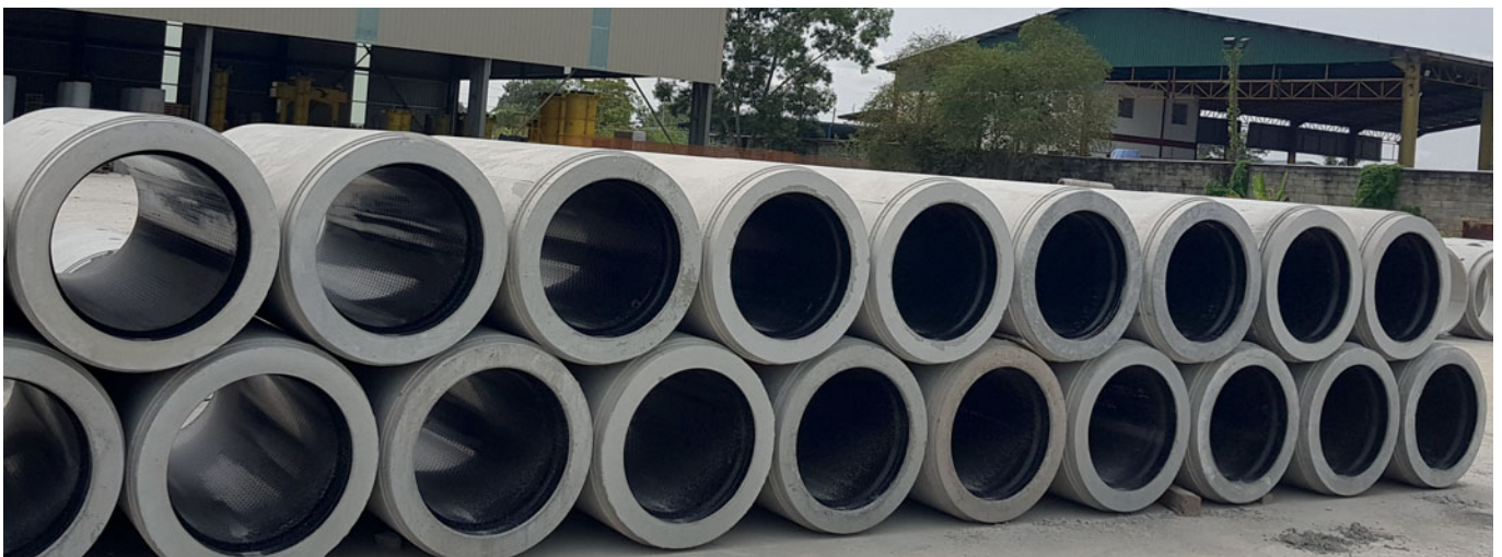
Perfect Jacking Pipe en el almacén exterior de Bilcon Industries

Los tubos más demandados para proyectos de infraestructura en Singapur son aquellos que no solo presentan una protección anticorrosiva duradera, con la consiguiente vida útil, sino que también se pueden instalar en condiciones de obra, de tal modo que no sufran daños en la fase de construcción. Este requisito de instalación reviste especial importancia en el caso de los tubos con diámetro de un ancho nominal que no permita el acceso, puesto que las mejoras son mucho más costosas de llevar a cabo que en las tuberías accesibles y, en algunos casos, imposibles, lo que implicaría sustituir al completo la estructura. El nuevo tubo de Bilcon Industries satisfacía a la perfección las expectativas de los proyectistas respon-