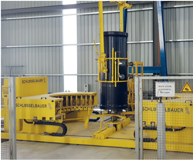
El cilindro soldado se traslada a la estación de transformación mediante una estructura auxiliar con grúa.