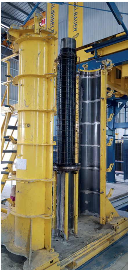
Núcleo de molde preparado con revestimiento Perfect y jaula de armadura

tubos de hormigón con revestimiento de HDPE, frente a tubos cerámicos o flexibles. Schlüsselbauer Technology ofrece el sistema de tubos de hormigón con protección anticorrosiva mediante revestimiento Perfect y con conectores de plástico (también llamados Perfect Connector) en el intervalo de anchos nominales de DN 250 a DN 1200.