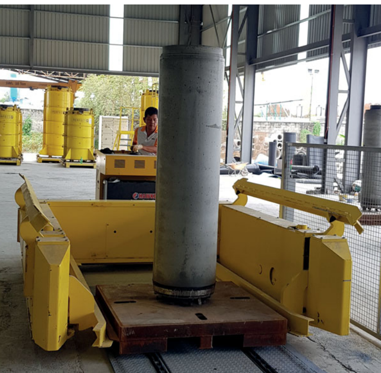
El transporte tiene lugar mediante un vehículo eléctrico.

tubos, sobre todo para proyectos de hincado, con los anchos nominales DN 300, DN 400, DN 500, DN 600, DN 700, DN 800 y DN 900. Todas las dimensiones forman parte de un sistema de producción ampliamente automatizado. Así, los cilindros se sueldan a partir de líneas de HDPE cuyos extremos se conforman termoplásticamente; a continuación, los moldes preparados se desplazan para el llenado con hormigón autocompactante (HAC) y, después, se desencofran los tubos endurecidos; todo ello de forma automática. La labor de los trabajadores en la producción de Perfect Pipe incluye procesos manuales de manipulación, limpieza y preparación, así como supervisar pasos concretos. A fin de satisfacer no solo los exigentes estándares de calidad del producto sino también de cumplir con la documentación, los tubos se dotan de una etiqueta en la que se indican todos los datos relevantes del producto, incluidos los controles de calidad, antes de abandonar las instalaciones.