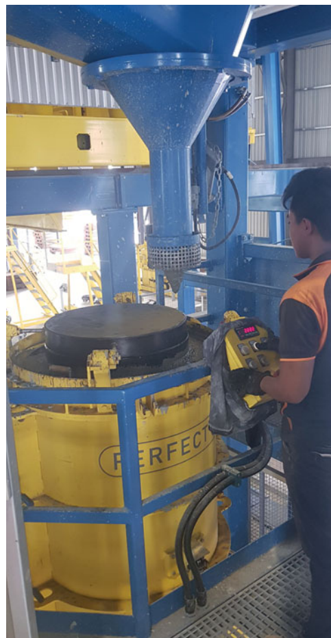
Llenado de los moldes con hormigón auto-compactante (HAC)