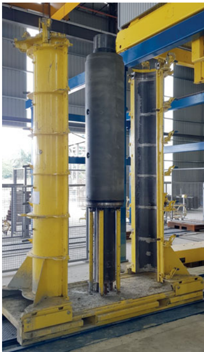
Perfect Jacking Pipe endurecida