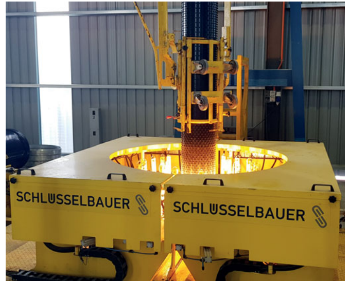
Allí se conforman termoplásticamente ambos extremos del revestimiento para crear el posterior manguito de tubo.

sables, de los contratistas públicos y privados y, por supuesto, de las empresas constructoras. Gracias a la experiencia positiva con Bilcon Perfect Pipe se da por sentado que en Singapur y Malasia se incorporarán a las especificaciones técnicas de los proyectos cada vez más tuberías de mayor tamaño con el mismo sistema de protección anticorrosiva continua y