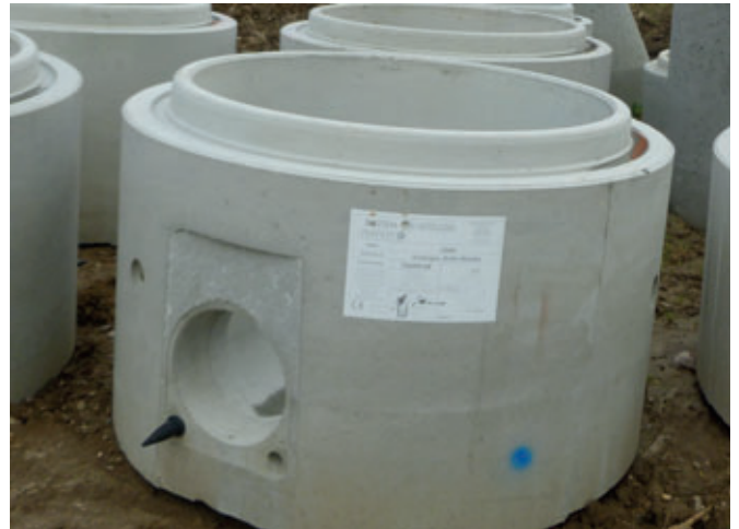
También la unión entre el tubo y el pozo se puede establecer con la ayuda de conectores y pernos de cizallamiento.

instalación es apreciado en igual medida por los clientes y las empresas de construcción.