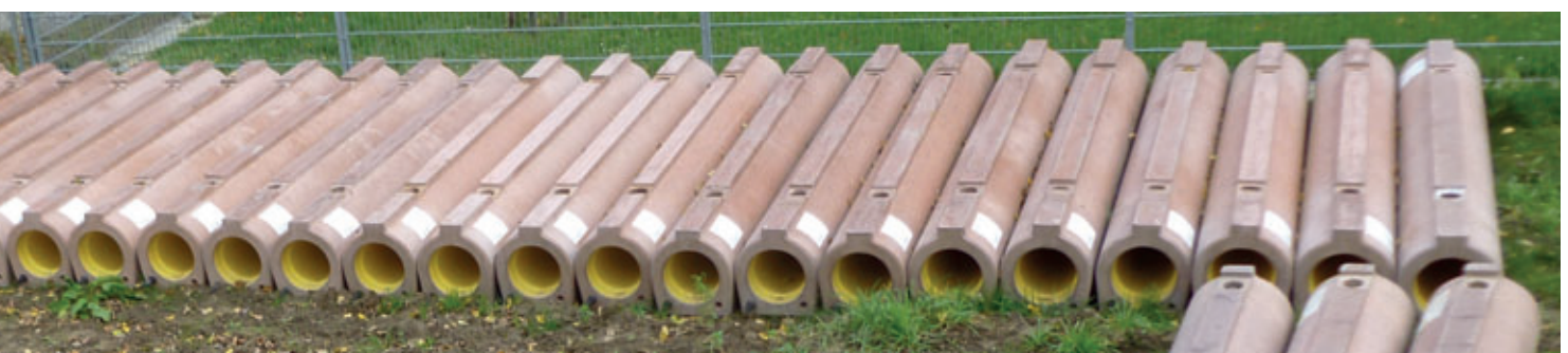
Típico almacén en la obra de Perfect Pipe DN250 en Endingen am Kaiserstuhl

Los tubos robustos de hormigón u hormigón armado tienen, por definición, un mayor peso por metro lineal que los tubos de otros materiales. Por este motivo, sobre todo en el modelo Perfect Pipe, diseñado como tubo base, se presta una gran importancia a la seguridad en el trabajo durante la fabricación, el transporte y la instalación de los tubos. Así, en la planta de produc-