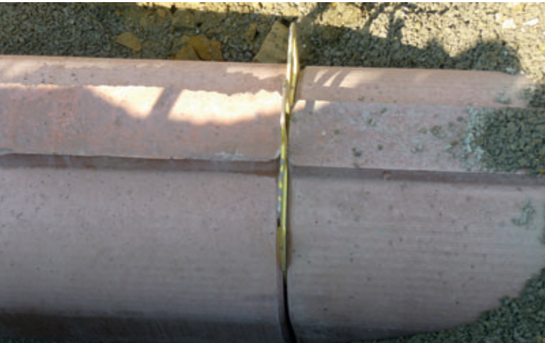
Las sencillas herramientas de posicionamiento se retiran después del ensamblaje de los tubos.