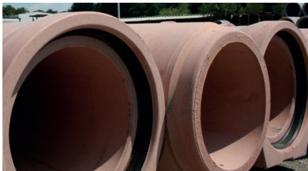
Tubos base de hormigón de hasta DN1200 se fabrican, en parte en función de su ancho nominal, con diferentes secciones transversales.