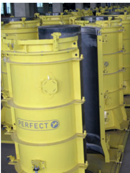
Equipamiento para la fabricación en serie de tubos de hormigón colados

sbm@sbm.at, www.sbm.at, www.perfectsystem.eu