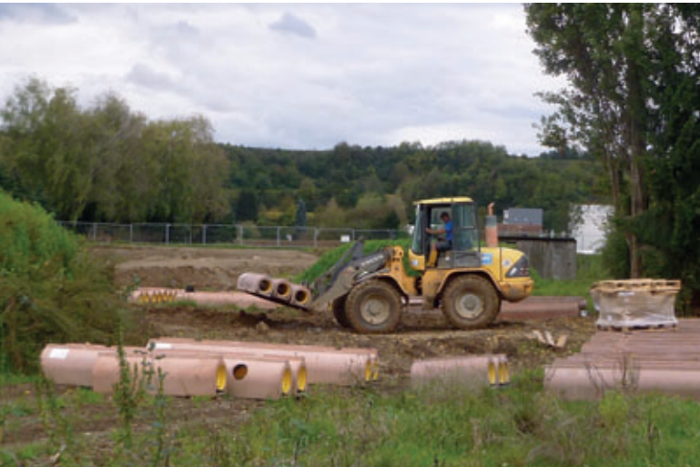
Los tubos se desplazan en la obra con la ayuda de equipamientos sencillos

ción se suelen ejecutar prácticamente todas las operaciones de fabricación después de la confección de los liners de HDPE de manera totalmente automática, de manera que los operadores solo se ocupan de tareas de control y actividades manuales ligeras. Por ejemplo, en una operación se fijan manualmente anclajes de elevación en los moldes de colada de hormigón. Una vez que se hayan endurecido los tubos, estos anclajes se encuentran incorporados firmemente en el hormigón y representan una base para la descarga segura en la obra y la colocación controlada de los tubos en la zanja mediante un equipo elevador. Tanto el transporte como también el almacenamiento en la obra se ven facilitados por la geometría del tubo base. Los tubos se pueden almacenar en una posición estable. También al instalar los tubos, se presta atención a la seguridad de los trabajadores. Una herramienta de posicionamiento sirve, por una parte, para mostrar al operador el asiento ideal del conector al ensamblar los tubos; por otra parte, le permite conducir el tubo de manera ideal y proteger al mismo tiempo sus manos. El hecho de que los fabricantes de tubos de hormigón utilicen los nuevos procedimientos de producción para tomar medidas concretas enfocadas a aumentar la seguridad en el trabajo para todos los implicados en el proceso de producción y de