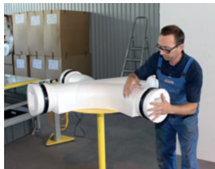
Colocación definitiva de las piezas de conexión de los tubos con las juntas montadas