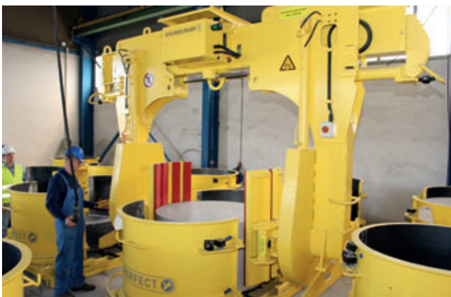
Travesaño de giro para piezas de hasta 9 t