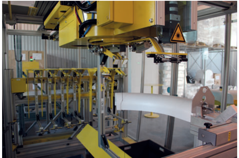
Para el corte de los negativos de la canaletas se utilizan sierras de filamento caliente que funcionan de forma bidimensional y tridimensional

de anillos y tubos de hormigón armado de Polonia. Todos los productos cuentan con los certificados correspondientes y cumplen todas las normas de calidad necesarias. El principal programa de producción se ve completado con elementos para la construcción de carreteras y de vallas.