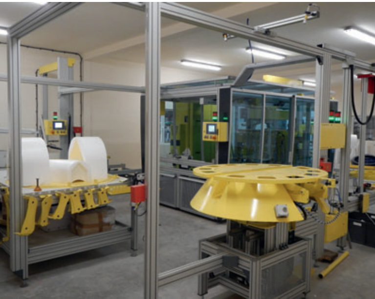
Las sierras de alambre caliente controladas por ordenador proporcionan un corte exacto de los moldes para los negativos de las canales necesarios.