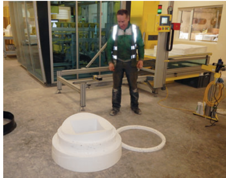
Moldes de las conexiones de tubos de EPS (espuma rígida de poliestireno) fabricados con exactitud.

la resistencia a la compresión y a la abrasión. En combinación con la estructura completamente densa de las bases de pozos monolíticas de Perfect se estima que la vida útil del producto supere los 100 años.