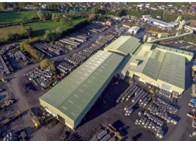
El recinto de la empresa Tracey Concrete Limited en Enniskillen, condado de Fermanagh, Irlanda del Norte.

Debido a las regulaciones locales con respecto al tamaño máximo permitido de las conexiones de los tubos, un requisito importante por parte de Tracey Concrete era que con el nuevo sistema de fabricación también se pudieran fabricar bases de pozos monolíticas con anchos nominales de hasta 1800 mm y realizar una configuración de canal adaptada individualmente. Ahora con el procedimiento Perfect se pueden fabricar por primera vez numerosas unida-