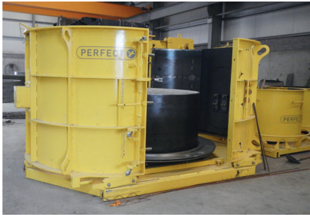
Con un diámetro de 1800 mm, Tracey Concrete fabrica bases de pozos de hormigón a medida utilizando moldes de EPS.