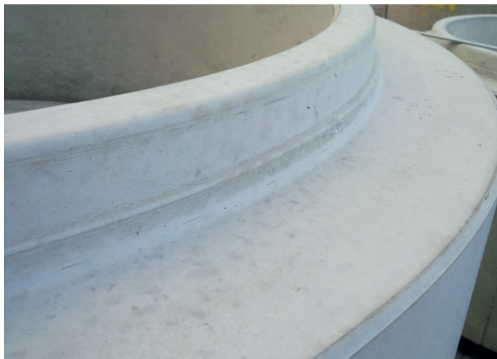
La superficie de hormigón impecable de los elementos de pozo de Perfect contribuye a alcanzar una vida útil estimada superior a los 100 años.

mente en las piezas correspondientes que simulan las conexiones de tubos posteriores y a lo largo de la fabricación se unen firmemente al hormigón circundante.