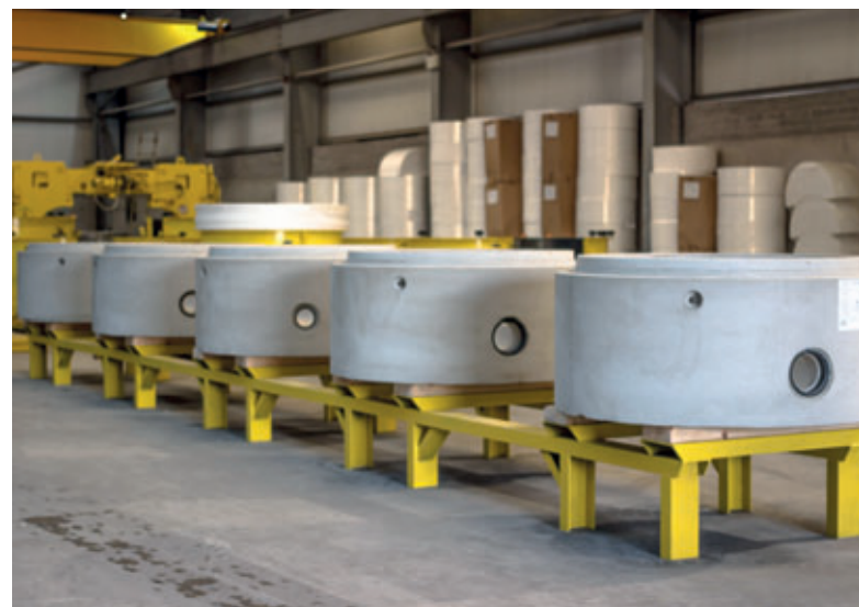
Bases de pozos de hormigón monolíticas con canales moldeados individualmente de la producción actual.