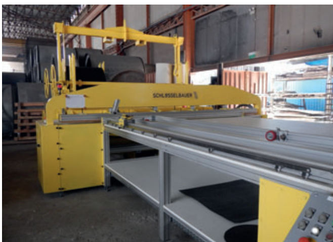
Tronzado y soldadura totalmente automática de la capa de liner Perfect según el diámetro de tubo deseado

Bilcon Industries, fabricante de tubos de hormigón y de piezas prefabricadas, hace alarde de una dilatada historia de éxito. La empresa, fundada en 1963 por don Tan