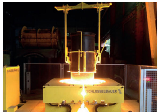
Conformación termoplástica de los extremos del liner Perfect para el asiento posterior del elemento de conexión