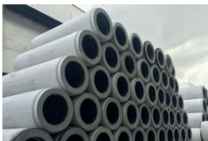
Almacén de tubos de perforación Perfect Pipe en la planta principal de Bilcon en Singapur

En la planta de Singapur se fabrican actualmente tubos de perforación Perfect