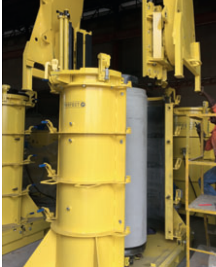
Desenfofrado de un tubo de perforación fraguado