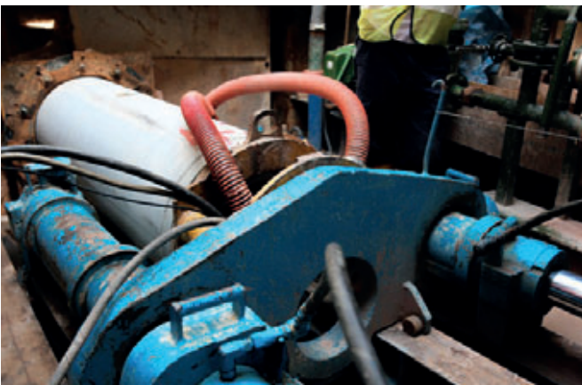
Introducción a presión del tubo