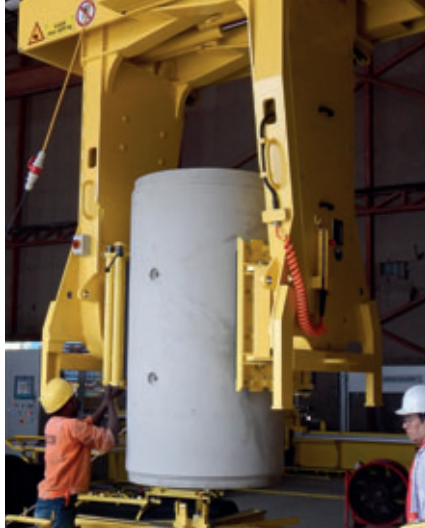
Trabajo seguro con la ayuda de un garfio

Leong Teck, fabrica desde hace más de 50 años productos para la evacuación estratégica de agua potable y aguas residuales, y es pionera en innovación y técnica. Así, ya en los años 80 comenzó a recubrir tubos de hormigón tradicionales con liner de plástico para mejorar la resistencia general a la corrosión de los sistemas de tubos de aguas residuales. Si bien en el pasado los sistemas de canalización de Singapur empleaban con frecuencia tubos cerámicos y comparativamente frágiles, en la actualidad resulta obvio que la tendencia se orienta hacia tubos de unión de hormigón y plástico caracterizados por su elevada resistencia frente a todo tipo de agresiones químicas.