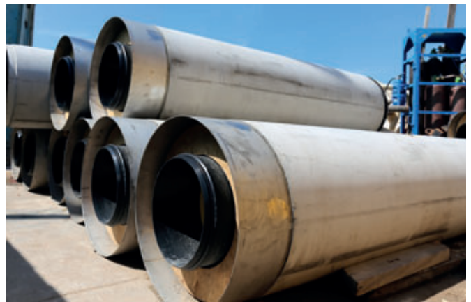
Almacén provisional de tubos de perforación Perfect Pipe en la obra