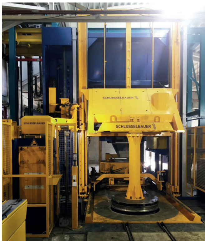
Die neue Produktionsanlage Typ Magic bei Zábojník s.r.o. in Veselí nad Moravou

Die Produktionsmengen von drei alten Rüttelpressmaschinen auf einer neuen, hochautomatisierten Anlage zu vereinen und gleichzeitig zusätzliche Fertigungskapazität und damit Wachstumsmöglichkeiten zu schaffen - so lautete die ursprüngliche Zielsetzung von Herrn Jaroslav Zábojník, dem Eigentümer von Zábojník s.r.o., beheimatet im tschechischen Veselí nad Moravou. Im Zuge der Präzisierung jener Produkte, die letztlich auf einer neuen Anlage produziert werden sollten, wurde rasch klar, dass die Mengenvorgaben nur ein Aspekt eines zukunftsorientierten Fertigungskonzeptes sein würden. Wesentlich für eine erfolversprechende Ausstattung waren darüber hinaus vor allem die Erfüllung gesteigerter Qualitätsanforderungen an die Fertigteile und die Prozess-Optimierung über das Maß des bis dahin Bekannten hinaus. Zur Erreichung der bestmöglichen Produktqualität sollten bei Zábojník s.r.o. die frisch entschalten Produkte auf einer Rahmenmuffe in den