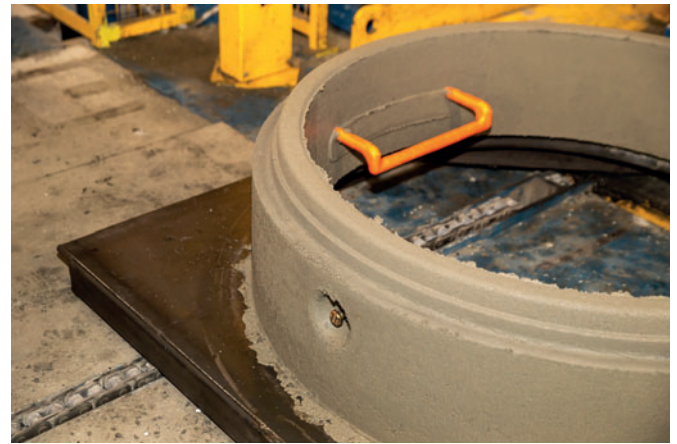
Neben den Hebeankern werden auch Steigbügel automatisch und taktzeitunabhängig an die Maschine übergeben und im Bauteil eingerüttelt.

Das sichere Handling von Betonfertigteilen vom Produktionsstandort bis zum Baustelleneinsatz wird immer mehr zu einer Grundvoraussetzung, um als Bauteilanbieter, Frächter oder Bauunternehmer beauftragt zu werden. Als verantwortungsvoller Produzent legt man bei Zábojník s.r.o. von jeher großes