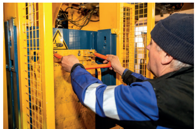
Der Maschinenbediener bereitet die jeweils benötigten Steigbügel für die automatische Übergabe an die Maschine vor.