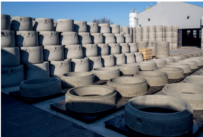
Gesamtansicht Lager

taktzeitunabhängig. Der Anlagenbediener hat lediglich die von der Bauteilhöhe abhängige Anzahl an Steigbügeln in der Übergabeeinheit des Stepmasters einzusetzen.