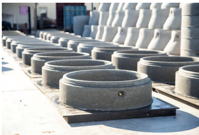
Die fest im Beton eingerüttelten Kugelpfanker bilden die Grundlage für sicheres Handling bis zum Versetzen auf der Baustelle