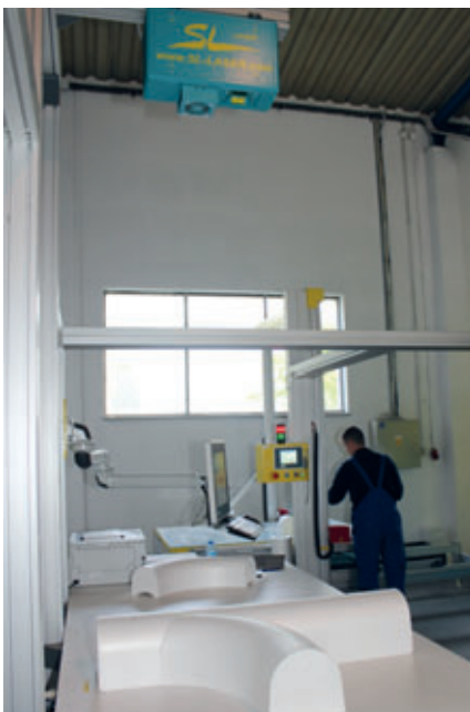
Für die Kontrolle der passgenauen Positionierung der Einzelteile sorgt ein Laser über dem Arbeitstisch, der alle Sohllinien des Schachtes kontinuierlich auf dem Tisch anzeigt.

Die einzelnen Negativgerinneteile aus Polystyrol-Hartschaum werden genau auf Form geschnitten, sodass sich diese ohne weitere manuelle Bearbeitung mittels Heißkleber problemlos zu einer Einheit zusammensetzen lassen. Für die Kontrolle der passgenauen Positionierung der Einzelteile sorgt ein Laser über dem Arbeitstisch, der alle Sohllinien des Schachtes kontinuierlich auf dem Tisch anzeigt. Nach dem