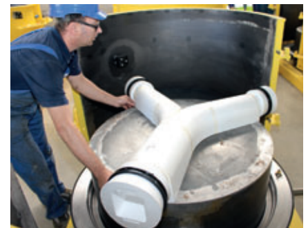
Einsetzen eines fertigen Negativgerinnes in eine Stahlform