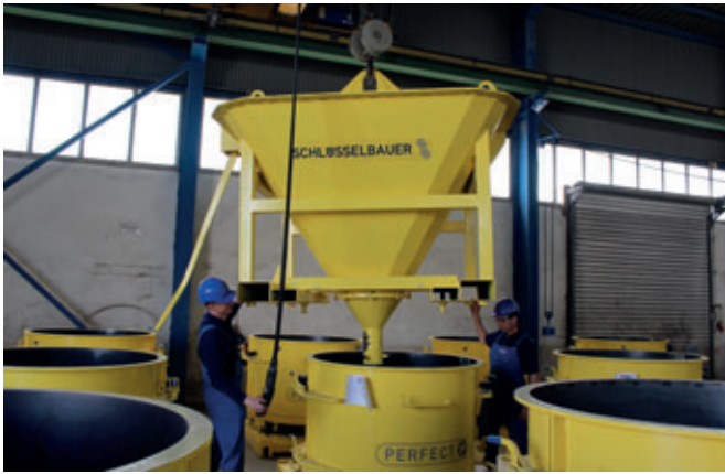
Betoniert wird dann bei Matbet Beton mit einem 2 m 3 -Kübel von Schlüsselbauer Technology