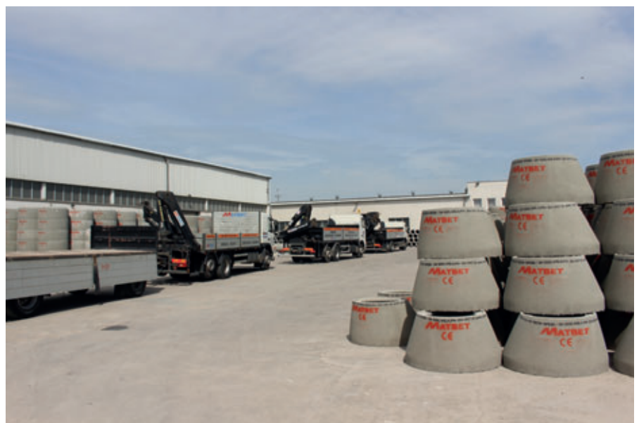
Matbet Beton ist einer der größten Produzenten von Stahlbetonringen und -rohren in Polen.