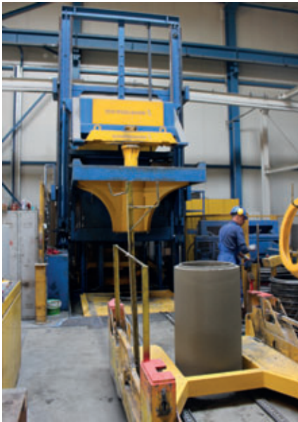
Seit 2005 bei Matbet im Einsatz: Fertigungsmaschine des Typs Magic von Schlüsselbauer Technology