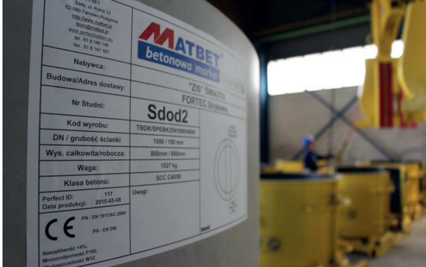
Die fertigen Betonschachtunterteile werden mit einem Aufkleber mit allen relevanten Daten und Parametern versehen.

Nun müssen noch die Gerinnenegative aus Hartschaum entfernt werden. Bei Matbet Beton werden die Schachtunterteile dazu mittels Gabelstapler in eine andere Halle transportiert. Die Negativerinne und Anschlüsse werden hier dann manuell unter Zuhilfenahme einfacher Werkzeuge von einem Mitarbeiter aus dem Betonschachtunterteil genommen. Abschließend sprüht ein Mitarbeiter großflächig das Matbet-Logo auf die Mantelfläche des Monolithen. Fertig ist das Matbet-Perfect-Betonschachtunterteil.