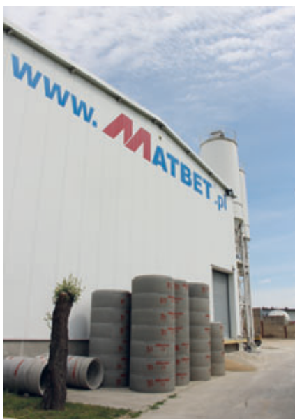
Betonwerk der Firma Matbet in Tarnowo Podgórze, Polen

Matbet Beton stellt in seinem Werk bei Poznan mit modernen, computergesteuerten Anlagen neben Betonringen, -bodenelementen, -sammelbehältern und -brunnen auch Betonrohre und Stahlbetonrohre in hohen Stückzahlen her und bietet damit komplette Lösungen für den Bau von Kanalisations-, Sanitär- und Regenwassersystemen. Matbet Beton ist einer der größten Produzenten von Stahlbetonringen und -rohren in Polen. Alle Erzeugnisse verfügen über entsprechende Zertifikate und erfüllen alle erforderlichen Qualitätsnormen. Das hauptsächliche Produktionsprogramm wird ergänzt durch Straßenbau- und Zaunelemente.