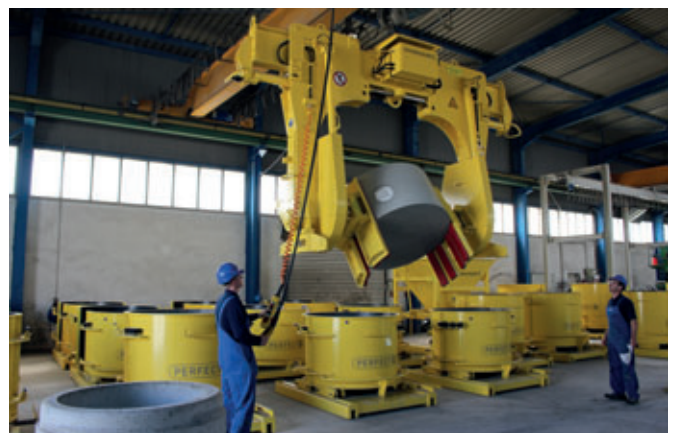
Die Bauteile werden um 180° gedreht.

Verkleben wird das gesamte Negativgerinne entsprechend dem Schachtdurchmesser beschnitten und abschließend um die benötigten Rohranschlussstücke ergänzt. Gegebenenfalls kommen Rohranschlussformteile mit aufgesetzten Dichtungen zum Einsatz. Diese integrierten Dichtungen werden später mit dem Gerinne in einem gemeinsamen Arbeitsschritt mit Beton vergossen und gehen dabei eine feste Verbindung mit dem Bauteil ein. Bei Verwendung integrierter Dichtungen entfällt der Einbau auf der Baustelle. Dichte und dauerhafte Verbindungen von Rohr und Schachtunterteil werden so sichergestellt.