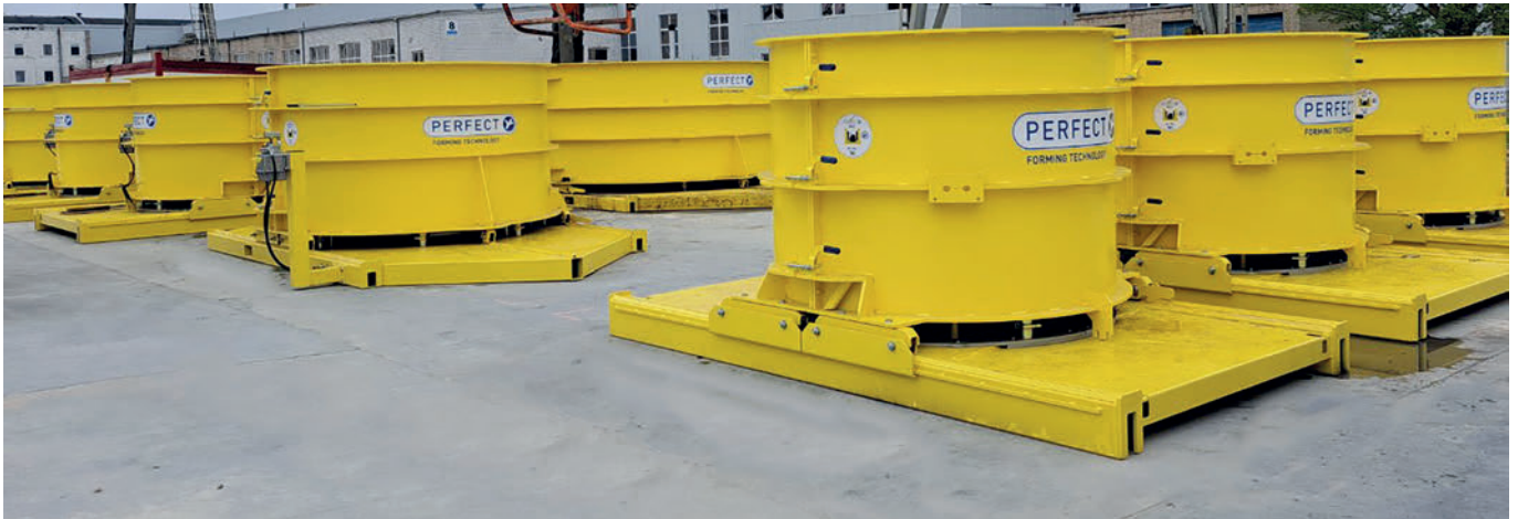
Konzept Perfect Forming Technology hier bis Bauteilinnendurchmesser 3.000 mm