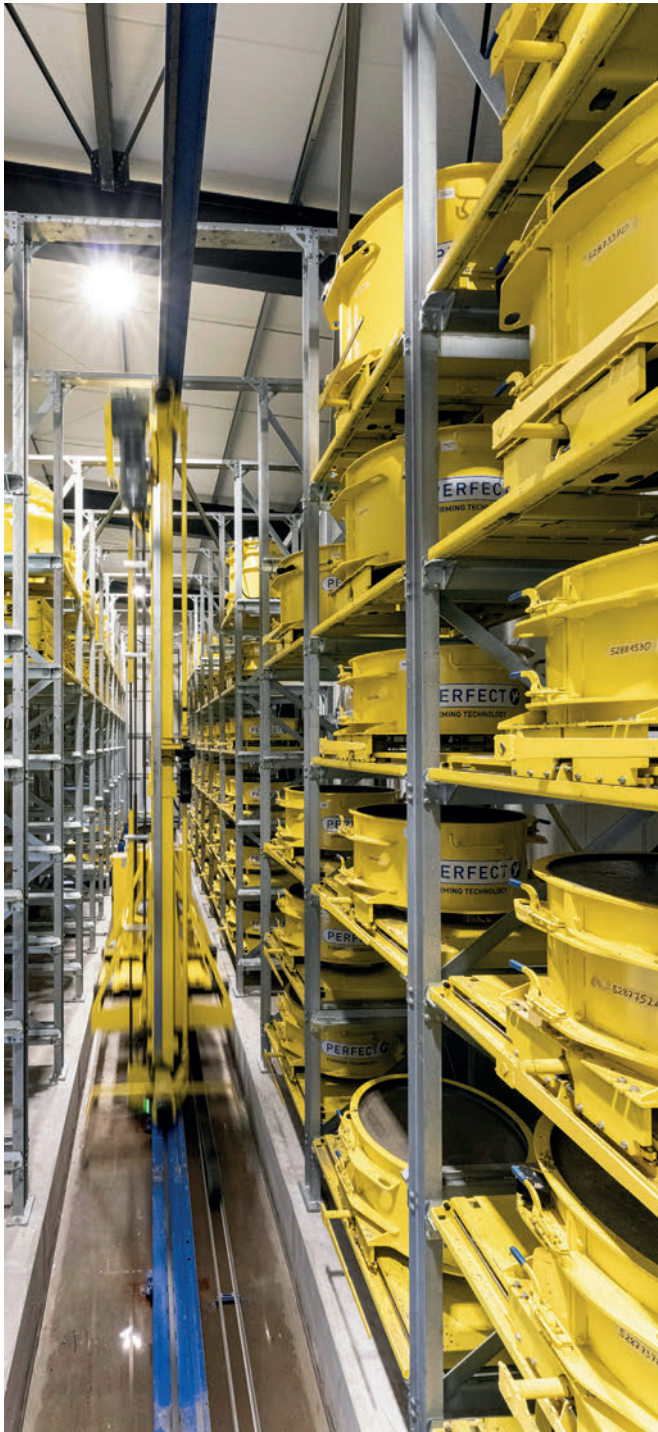
Regallager als effiziente platzsparende Aushärtebereiche für schalungserhärtete Produkte

wicklung im Formenbau ermöglicht es, die Produktqualität in Bereichen zu beeinflussen, die zum Einbaupunkt nicht im Vordergrund der Entscheidungsträger standen. Unter Umständen kann das zuvor genannte Design-Prinzip „Form follows function“ sogar nutzenstiftend gewendet werden: „Gesteigerte Funktionalität durch entsprechendes Formen-Design“. Die Ingenieure bei Schlüsselbauer Technology sind in jedem Projekt - egal ob Einzelform oder automatisierte Massenfertigung mit Hunderten Formen - angespornt, den Nutzen von Endprodukt und Formentechnik zu erhöhen.