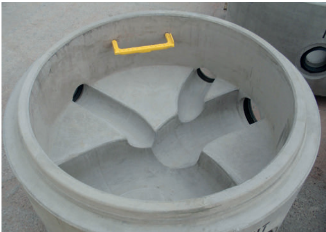
Unterschiedliche Einbauten (Dichtungen, Steigbügel, etc.) und individuelle Gerinne

ändernden Ansprüchen. Zurückkommend auf das Themenfeld Betonbauteile könnte der Leitsatz umgemünzt werden auf das Design hochbelastbarer Bauteile. Trotz aller am Endprodukt unsichtbarer Bewehrungsmaßnahmen trägt bereits