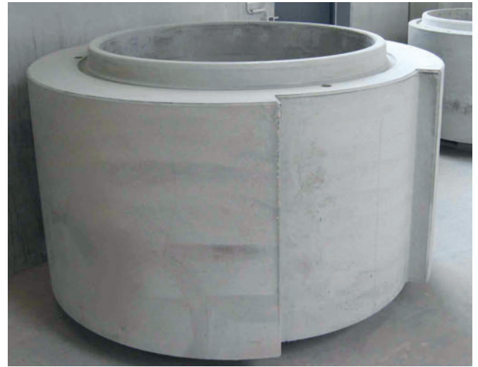
Formenkomponenten für Optimierung Produktgewicht und -design

zwei Jahren wurde diese Entwicklung auf ein Niveau gehoben, das in nur einer Arbeitsschicht die Produktion von bis zu 100 unterschiedlichen – sprich individuellen – Schachtböden ermöglichte. Die Eignung der Formen für automatisierte Abläufe war einer der Eckpunkte der Verbindung von industrieller Fertigung & Losgröße 1.