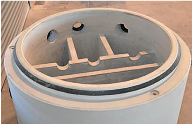
Bauteil-Variabilität auf Basis funktioneller Gießformen